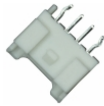
B04B-PASK-1(LF)(SN) JST Sales America Inc. CONN HEADER PA 4POS TOP W/BOSS