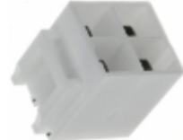
B04P-VL JST Sales America Inc. CONN HEADER 4POS VL SERIES TIN