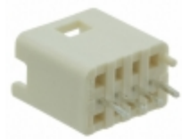
B04B-PNISK-1A(LF)(SN) JST Sales America Inc. CONN HEADER 4 POS T/H 2.0MM