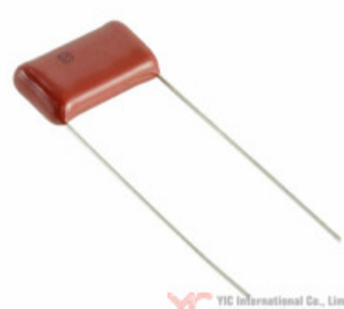
Image may be representation. See specs for product details.