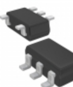
XC6124D519MR-G Torex Semiconductor Ltd IC WATCHDOG TIMER SOT-25