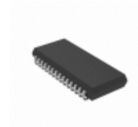
AS7C3256A-10JCNTR Alliance Memory, Inc. IC SRAM 256KBIT 10NS 28SOJ