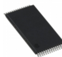
AS7C3256A-10TCNTR Alliance Memory, Inc. IC SRAM 256KBIT 10NS 28TSOP