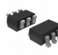
BC846BS/ZLX Nexperia USA Inc. TRANS 2NPN 65V 0.1A 6TSSOP