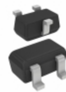
BC846BT,115 NXP USA Inc. TRANS NPN 65V 0.1A SOT416