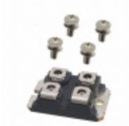
DHG50X1200NA IXYS DIODE MODULE 1.2KV 25A SOT227B