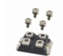
DHG50X600NA IXYS DIODE MODULE 600V 50A SOT227B