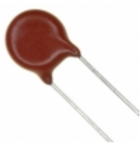
V275LS10P Littelfuse Inc. VARISTOR 389V 2.5KA DISC 10MM