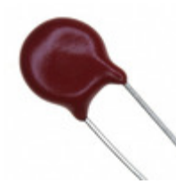
V275LC4P Littelfuse Inc. VARISTOR 430V 1.2KA DISC 7MM