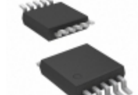
MCP4232-502E/UN Microchip Technology IC POT DGTL 5K 129TAPS 10-MSOP