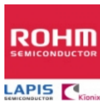
BU4819G ROHM BU4819G ROHM