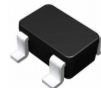
BU4820F-TR Rohm Semiconductor IC VOLT DETECTOR 2.0V SOP4