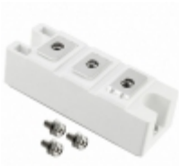
MD200A16D2-BP Micro Commercial Co DIODE RECT 1600V 200A D2 PAC