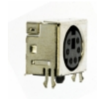
MD2-60ST-SMT CUI Inc. CONN MINI-DIN 6PIN R/A SLIM SMD