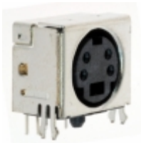
MD2-40ST CUI Inc. CONN MINI-DIN 4PIN R/A SLIM PCB