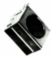
MD2-40ST-SMT CUI Inc. CONN MINI-DIN 4PIN R/A SLIM SMD