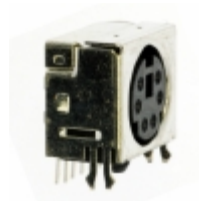
MD2-60ST CUI Inc. CONN MINI-DIN 6PIN R/A SLIM PCB