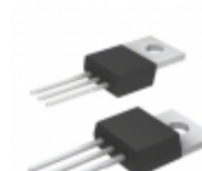
TC1264-2.5VAB Microchip Technology IC REG LDO 2.5V 0.8A TO220-3