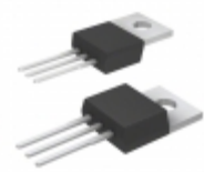
TC1264-3.3VAB Microchip Technology IC REG LDO 3.3V 0.8A TO220-3