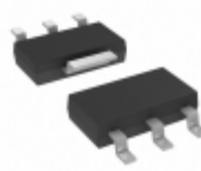
TC1264-2.5VDBTR Microchip Technology IC REG LDO 2.5V 0.8A SOT223-3