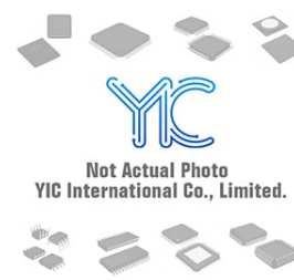
LTC4211IMS#TRPBF. LT LT MSOP10