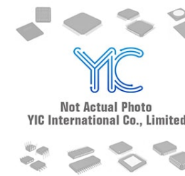
IRS21834S IR IRS21834S IR