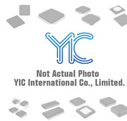
IRS21834STRPBF. IR IR SOP14