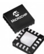
PIC16F526-E/MG Microchip Technology IC MCU 8BIT 1.5KB FLASH 16QFN