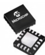
PIC16F526-I/MG Microchip Technology IC MCU 8BIT 1.5KB FLASH 16QFN