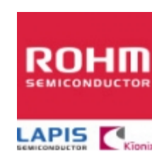
MTZJT-7233B/33V ROHM MTZJT-7233B/33V ROHM