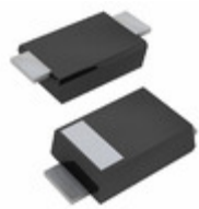
PMEG6030EVPX Nexperia USA Inc. DIODE SCHOTTKY 60V 3A SOD128