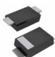
PMEG6030EP/8X Nexperia DIODE SCHOTTKY 60V 3A CFP5