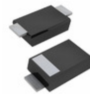
PMEG6030ELPX Nexperia USA Inc. DIODE SCHOTTKY 60V 3A SOD128