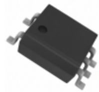
ACPL-M72T-560E Broadcom Limited OPTOISO 4KV PUSH PULL 5SO