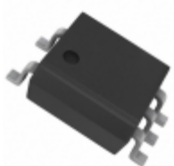
ACPL-M72U-000E Broadcom Limited OPTOISO 3.75KV PUSH PULL 5SO