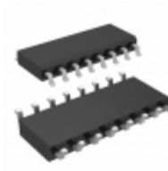
DG201ACSE Maxim Integrated IC SWITCH QUAD SPST 16SOIC