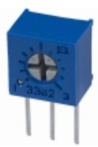
3362M-1-102R Bourns, Inc. TRIMMER 1K OHM 0.5W PC PIN SIDE