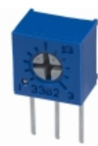
3362M-1-102LF Bourns, Inc. TRIMMER 1K OHM 0.5W PC PIN SIDE