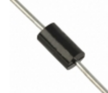
P6KE11CA AMI Semiconductor / ON Semiconductor TVS DIODE 9.4V 15.6V DO15