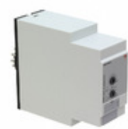
PAA01DM24 Carlo Gavazzi DPDT DELAY ON OPERATE TIMER