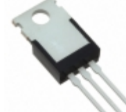
IXFP14N85X IXYS MOSFET N-CH 850V 14A TO220-3