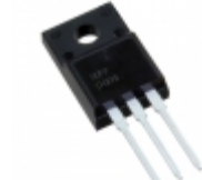
IXFP14N85XM IXYS MOSFET N-CH 8500V 14A TO220