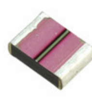
63ST684MC14532 Rubycon CAP FILM 0.68UF 20% 63VDC 1812