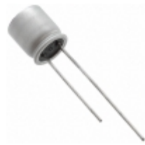
63SXE33M Panasonic Electronic Components CAP ALUM POLY 33UF 20% 63V T/H