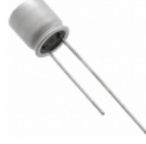
63SXE39M Panasonic SXE SERIES - OSCON THT TYPE 63V