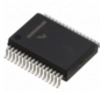
MC33395EW NXP USA Inc. IC GATE DRIVER 3PHASE 32SOIC