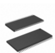
CY7C1061AV33-12ZXCT Cypress Semiconductor Corp IC SRAM 16MBIT 12NS 54TSOP