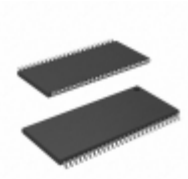
CY7C1061BV33-8ZXI Cypress Semiconductor Corp IC SRAM 16MBIT 8NS 54TSOP