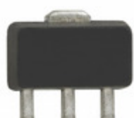
SBB-4089Z RF Solutions IC AMP HBT INGAP/GAAS SOT-89