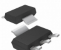
LT1521CST-5#TRPBF Linear Technology IC REG LDO 5V 0.3A SOT223