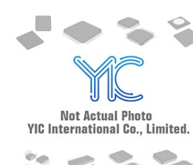
LT1521CST-5#TR LT LT SOT-223