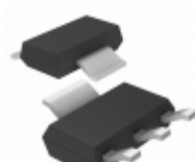
LT1521CST-5#TRPBF ADI (Analog Devices, Inc.) IC REG LINEAR 5V 300MA SOT223-3