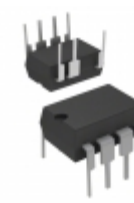
VIPER17HN STMicroelectronics IC OFFLINE CONV PWM OVP OCP 8DIP