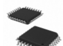
MC100EP142FAG ON Semiconductor IC REGISTER SHFT 9BIT ECL 32LQFP