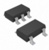
MIC5319-1.85YD5-TR Microchip Technology IC REG LDO 1.85V 0.5A TSOT23-5