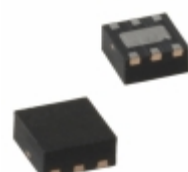
MIC5319-1.85YML-TR Microchip Technology IC REG LDO 1.85V 0.5A 6MLF