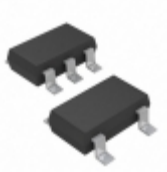
MIC5319-1.85YD5 Microchip Technology IC REG LDO 1.85V 0.5A TSOT23-5