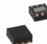
MIC5319-1.85BML-TR Microchip Technology IC REG LDO 1.85V 0.5A 6MLF