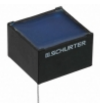
DS1-175-0002 Schurter Inc. COMMON MODE CHOKE 630MA 2LN TH