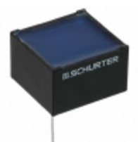
DS1-175-0003 Schurter Inc. COMMON MODE CHOKE 1A 2LN TH