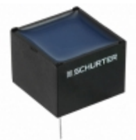
DS1-20-0003 Schurter Inc. COMMON MODE CHOKE 3.15A 2LN TH