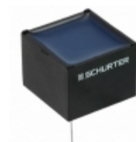
DS1-20-0001 Schurter Inc. COMMON MODE CHOKE 630MA 2LN TH