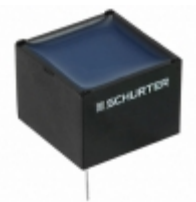
DS1-20-0002 Schurter Inc. COMMON MODE CHOKE 1.4A 2LN TH