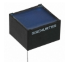
DS1-175-0005 Schurter Inc. COMMON MODE CHOKE 3A 2LN TH