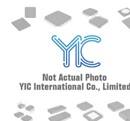
MIC5259-1.8BD5 Micrel Micrel TSOT23-5