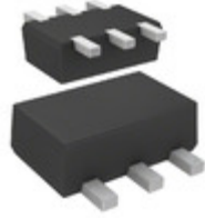
DMG564060R Panasonic Electronic Components TRANS PREBIAS NPN/PNP SMINI6