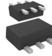
DMG564H20R Panasonic Electronic Components TRANS PREBIAS NPN/PNP SMINI6