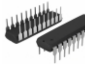
PIC16LC771/P Microchip Technology IC MCU 8BIT 7KB OTP 20DIP