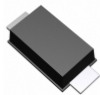
RBR2MM60BTR Rohm Semiconductor DIODE SCHOTTKY 60V 2A PMDU