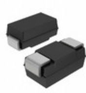
RBR3L30BTE25 Rohm Semiconductor DIODE SCHOTTKY 30V 3A PMDS