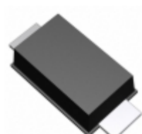
RBR2MM40ATR Rohm Semiconductor DIODE SCHOTTKY 40V 2A PMDU