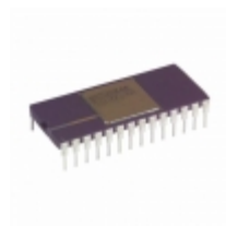
AD667AD Analog Devices Inc. IC DAC 12BIT W/BUFF LTCH 28-CDIP