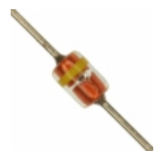
MTZJT-7227C Rohm Semiconductor DIODE ZENER 27V 500MW DO34