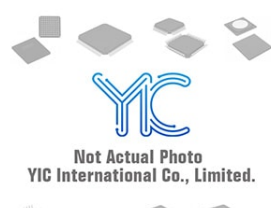
MTZJT-722.4B ROHM ROHM DO-34