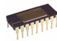
AD570SD/883B Analog Devices Inc. IC ADC 8BIT MONO W/CLOCK 18CDIP