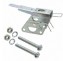
AD5721 Honeywell Sensing and Productivity Solutions SWITCH LEVER ASSMBLY