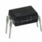
APT1231 Panasonic PHOTOTRIAC COUPLER 600V 4DIP