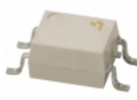
APT1231S Panasonic Electric Works OPTOISOLATOR 3.75KV TRIAC 4SOP