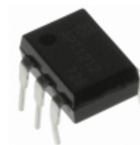
APT1222WA Panasonic Electric Works OPTOISOLATOR 5KV TRIAC 6DIP