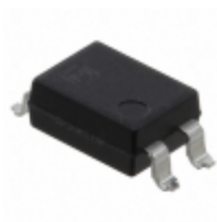
APT1231A Panasonic PHOTOTRIAC COUPLER 600V 4DIP