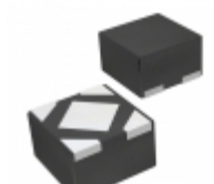
MIC5317-3.3YMT-TZ Microchip Technology IC REG LDO 3.3V 0.15A 4TDFN