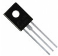
BD37610STU Fairchild/ON Semiconductor TRANS PNP 45V 2A TO-126