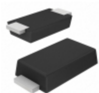
SE30AFDHM3/6A Electro-Films (EFI) / Vishay DIODE GEN PURP 200V 1.4A DO221AC