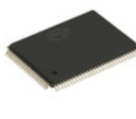
CY7C1360C-200AJXCT Cypress Semiconductor Corp IC SRAM 9MBIT 200MHZ 100LQFP