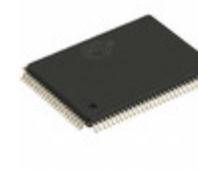
CY7C1360C-200AJXC Cypress Semiconductor Corp IC SRAM 9MBIT 200MHZ 100TQFP