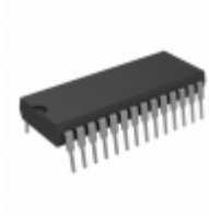
AT28HC256F-12PI Microchip Technology IC EEPROM 256KBIT 120NS 28DIP