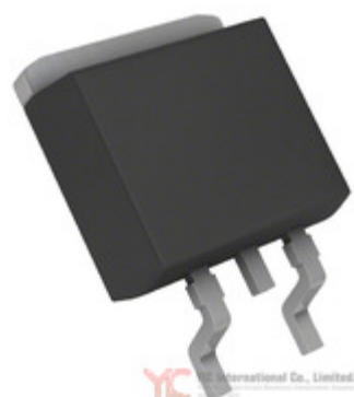
Image may be representation. See specs for product details.