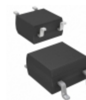
CPC1006NTR IXYS Integrated Circuits Division RELAY OPTOMOS SP-NO 75MA 4-SOP