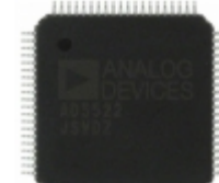
AD5522JSVDZ Analog Devices Inc. IC PMU QUAD 16BIT DAC 80- TQFP