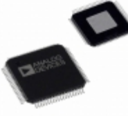
AD5522JSVUZ-RL Analog Devices Inc. IC PMU QUAD 16BIT DAC 80- TQFP