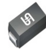
P4SMA130A R3G TSC (Taiwan Semiconductor) TVS DIODE 111V 179V DO214AC