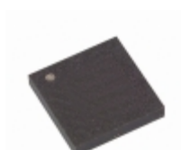
AT25256-10CC Microchip Technology IC EEPROM 256KBIT 3MHZ 8LAP