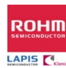
MTZJT-725.6B/5.6V ROHM MTZJT-725.6B/5.6V ROHM