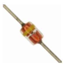
MTZJT-726.8B Rohm Semiconductor DIODE ZENER 6.8V 500MW DO34