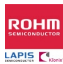
MTZJT-726.8B/6.8V ROHM MTZJT-726.8B/6.8V ROHM