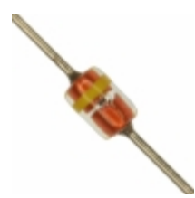
MTZJT-726.2C Rohm Semiconductor DIODE ZENER 6.2V 500MW DO34